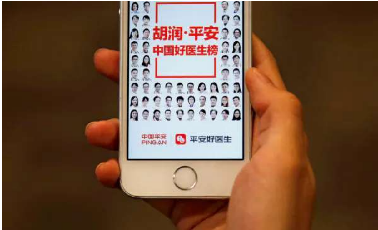
中国ではオンライン診療が急拡大している

2020/5/17 20:00 (2020/5/18 5:10更新) | 日本経済新聞 電子版